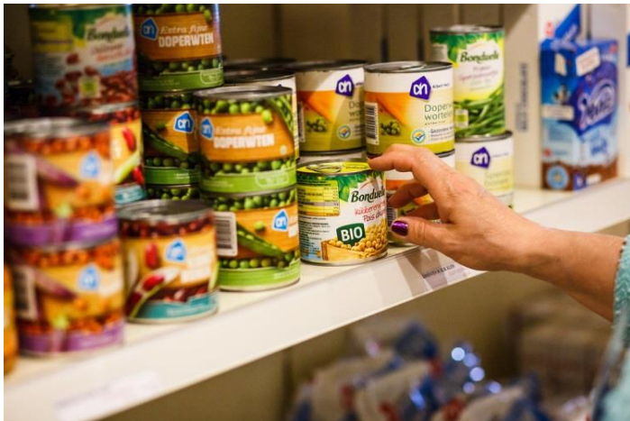
Indruk van het assortiment bij de Sociale Kruidenier

Op dit moment biedt de Sociale Kruidenier een vast assortiment van lang houdbaar voedsel en non-food artikelen aan. Dit aanbod is bij aanvang van de winkel samengesteld als aanvulling op het noodhulp pakket van de Voedselbank, en in de loop van 2016 aangepast aan de wensen en behoeften van de klanten. Klanten kunnen er bij de Sociale Kruidenier op rekenen dat dit basisassortiment standaard in de winkel ligt, omdat we onze bezoekers willen behandelen als klanten door hen keuzevrijheid te garanderen. Uit rondvraag onder de klanten blijkt dat veel bezoekers naast het huidige assortiment ook behoefte hebben aan kleding en verse voedselproducten, zoals vlees, eieren of brood. In 2017 willen we de mogelijkheden hiervoor verder onderzoeken. Daarnaast is het voor 2017 van belang dat we een aantrekkelijk basisaanbod kunnen blijven garanderen, zodat we de doelgroep ook zullen blijven bereiken.