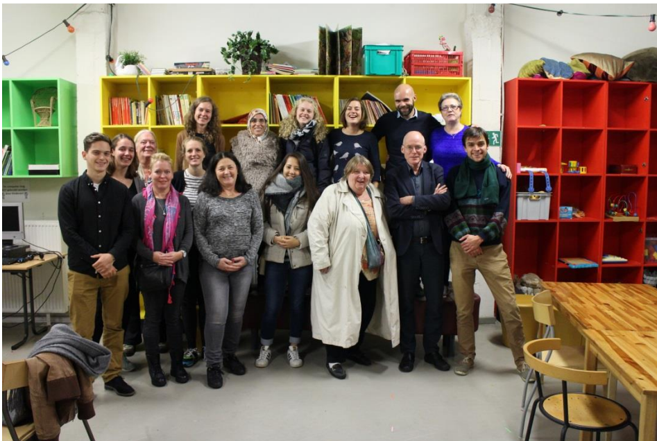
Het team van de Sociale Kruidenier Amsterdam op bezoek bij de Sociale Kruidenier in Antwerpen, november 2016

De Sociale Kruidenier is twee dagen in de week geopend en de winkel zelf wordt, op een betaalde coördinator (0,8 FTE) na, gedraaid door een team van 10 vrijwilligers. We streven hierbij naar een goede verdeling van vrijwilligers uit de doelgroep en daarbuiten: op dit moment is de verdeling ongeveer 50/50. Vrijwilligers uit de doelgroep willen vaak graag 'iets terugdoen' en hebben een goede aansluiting op de belevingswereld van de klant die in armoede leeft. Uit een enquête onder onze klanten blijkt dat zij de Sociale Kruidenier als een fijne en prettige plek ervaren, onder meer door de vriendelijke houding van het personeel. Door middel van groepstraining en andere teamactiviteiten proberen wij het belang van klantvriendelijkheid ook steeds bij onze vrijwilligers onder de aandacht te brengen. Zo bracht in november 2016 het hele team (vrijwilligers en professionals vanuit de Protestantse Diaconie) een zeer inspirerend bezoek aan de Sociale Kruidenier in Antwerpen.