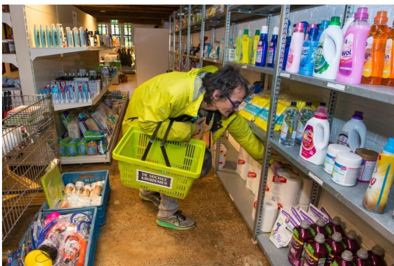
Winkelende klant in de Sociale Kruidenier