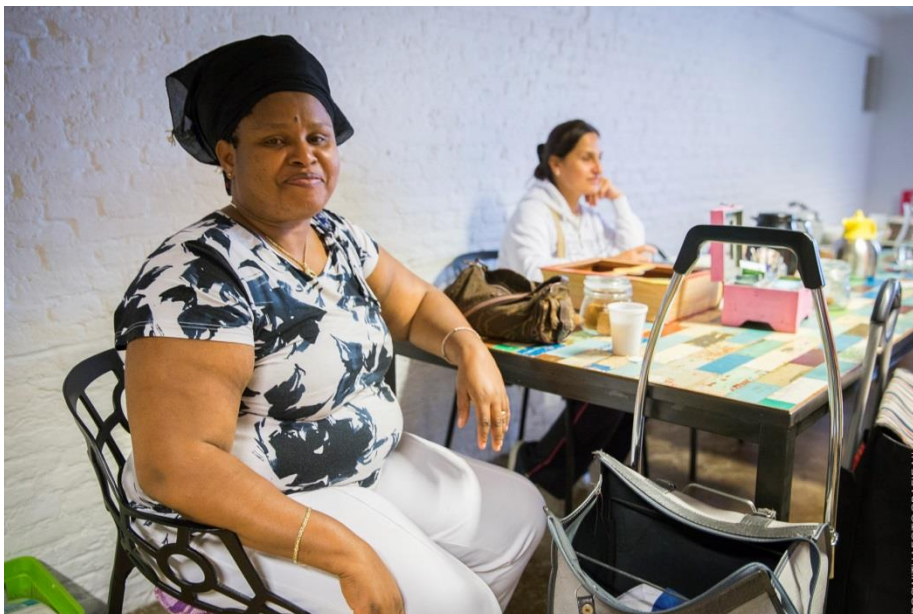
Klant aan de koffietafel in de Sociale Kruidenier

Uit: Initiatieven die voedselhulp bieden via een winkelmodel – Een verkenning (Kerk in Actie), nog niet gepubliceerd